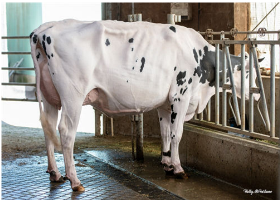
PROGENESIS BOMBA PARAGON GRANDDAM